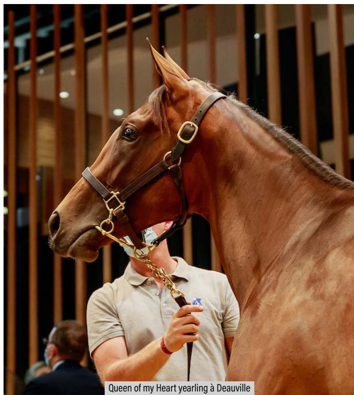
Queen of my Heart yearling à Deauville