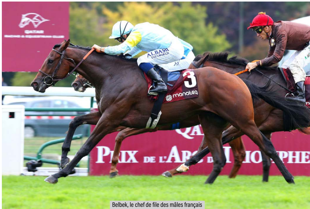
Belbek, le chef de file des mâles français