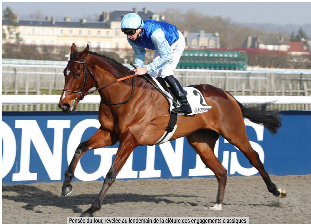
Pensée du Jour, révélée au lendemain de la clôture des engagements classiques

Le 15 février, lorsque France Galop a validé les engagements aux classiques et aux Prix Saint-Alary et Grand Prix de Paris, on a relevé une légère baisse des vocations. Cela dit, 489 poulains et pouliches de la génération 2020 nous garantissent quand même une base suffisamment solide pour analyser la tendance des courses et de l'élevage en France, comme en Europe, puisque les étrangers sont en majorité.