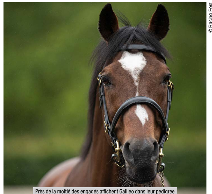
Près de la moitié des engagés affichent Galileo dans leur pedigree